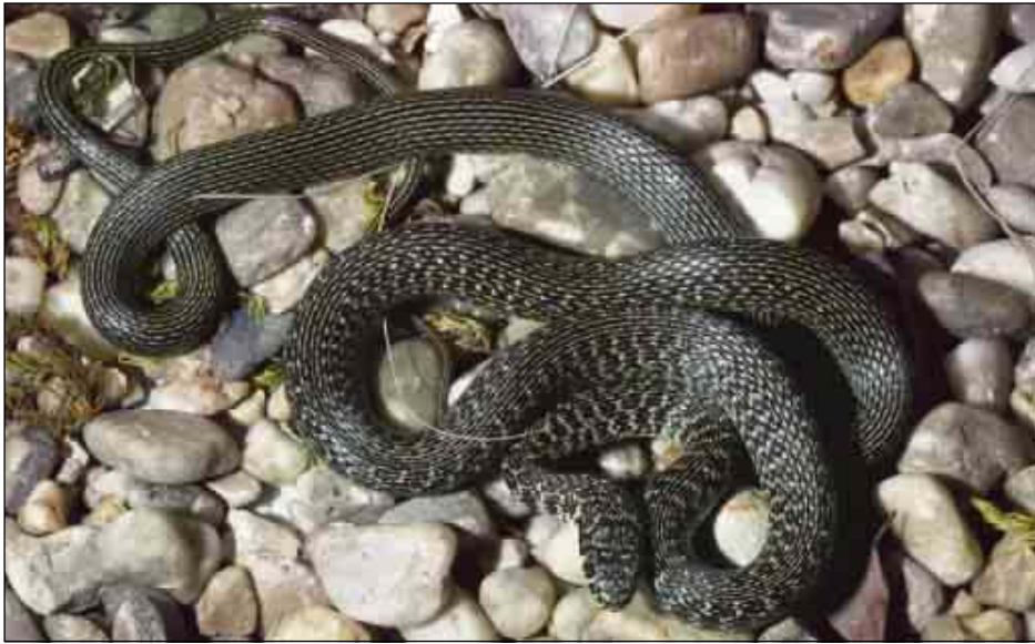
Ejemplar de Huesca.

Serp verd-groga (cat.), suge berde-horia (eusk.)