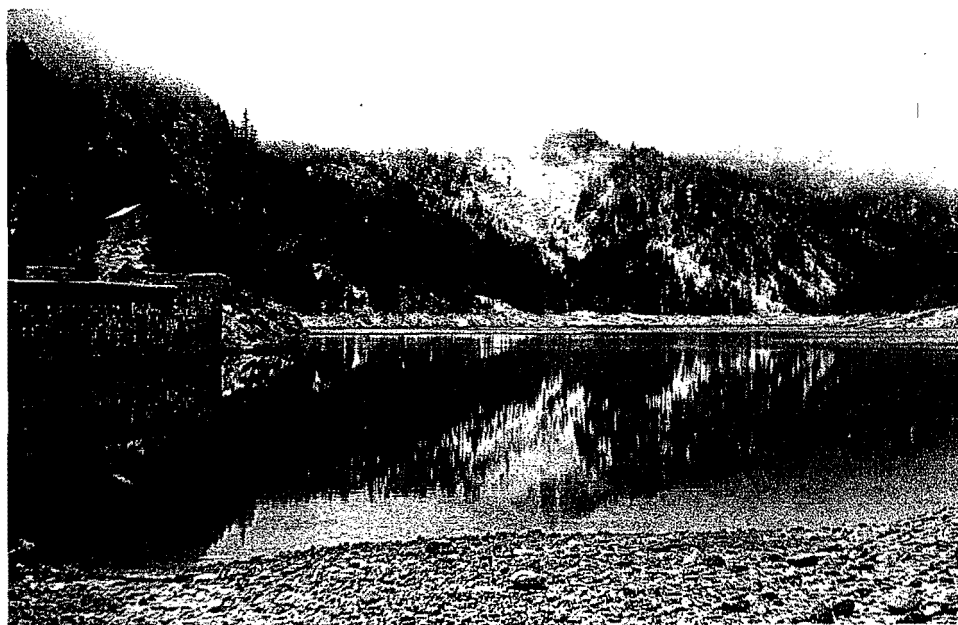
Parque Nacional d'Aigües Tortes i Estany de Sant Maurici. Sant Maurici. Autor: J. González-Solís.