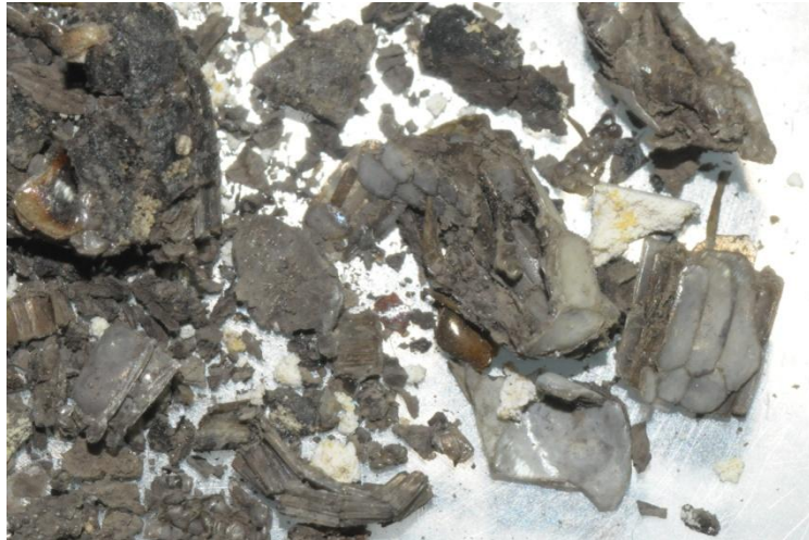
Fig. 6 .: Excrement d' Hemorrhois hippocrepis contenint escames caudals i ventrals de lacèrtid.