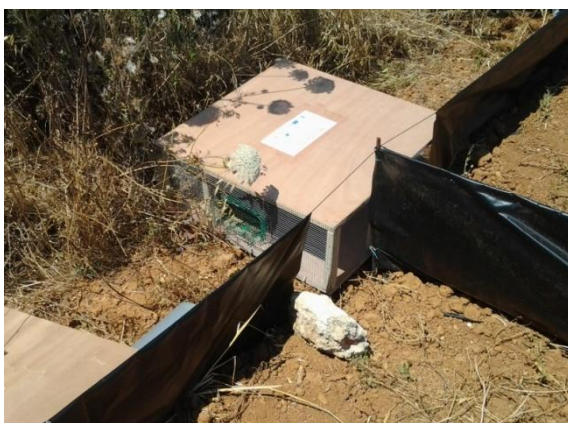
Fig. 3. Trampa tipus caixa amb malles de desviament.

Les ubicacions de les trampes (Fig. 4) coincideixen normalment amb els vivers dels quals se sospita que poden ser les fonts d'entrada dels ofidis, a les rodalies de les zones abans esmentades, sempre seguint consells i recomanacions d'experts en quant a les condicions d'ombra / sol, humitat, vegetació, murs, etc.