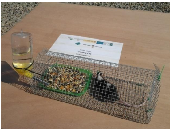
Fig. 1: Gàbia amb el ratolí viu, que es col·loca a l'interior de la trampa.

Degut a la mortalitat massiva dels ratolins, després de la primera setmana es va deixar d'utilitzar l'animal viu com a esquer en aquest tipus de trampa, tanmateix es va mantenir el cadàver per provar-lo com a mètode d'esquer.