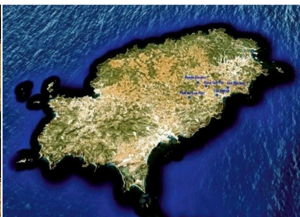
Fig 4: Ubicacions de les trampes a l'illa d'Eivissa.