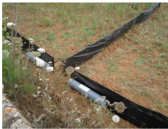
Fig. 2: Trampes de doble embut amb utilització de malles de desviament.