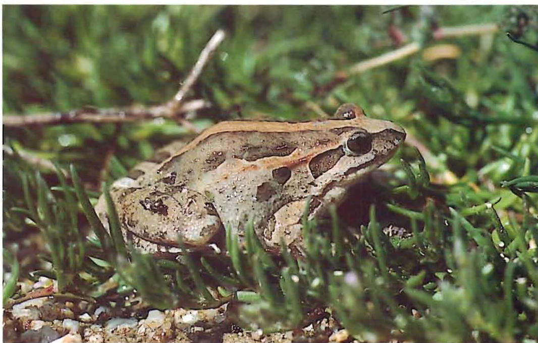
Discoglossus pictus . Aiguamolls de l'Empordà, Gerona, 01.04.91 (Salvador Domenech).